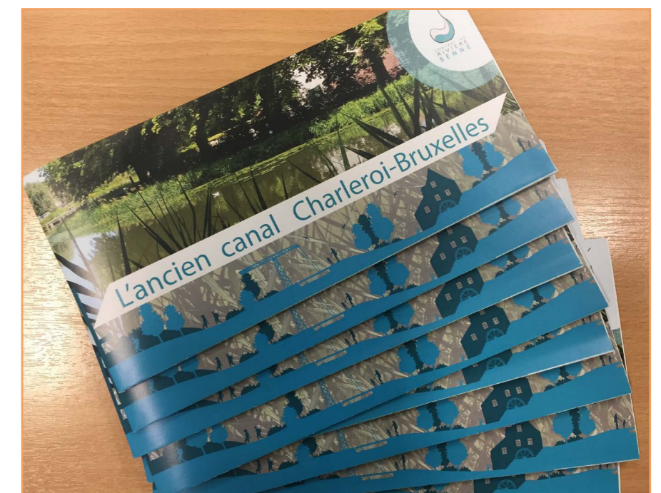
Dépliants de l'ancien canal disponibles sur demande au CR Senne ou sur notre site web : https://www.crsenne.be/actualites-infosenne/

La vallée de la Samme est très belle et pleine d'histoire mais elle subit beaucoup de pressions. Aujourd'hui différents partenaires tentent de lui redonner la valeur qu'elle mérite.