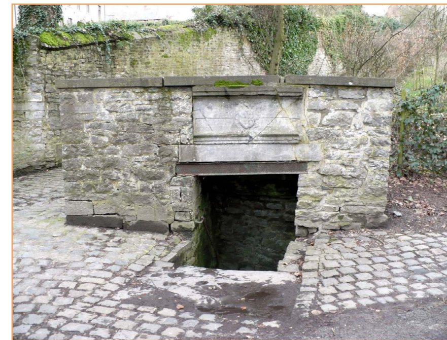
La Coulette : La pierre armoriée est gravée d'une inscription « Coule toujours Coulette » ©CRSenne

Rien qu'à Feluy, il y a 17 fontaines aménagées ... Avant la distribution publique de l'eau dans toutes les habitations, l'approvisionnement en eau de chaque quartier et hameau se faisait aux fontaines publiques. Aujourd'hui, les plus connues et visibles se trouvent au centre de Feluy: la fontaine « Coulette » et celle du Tremblement.