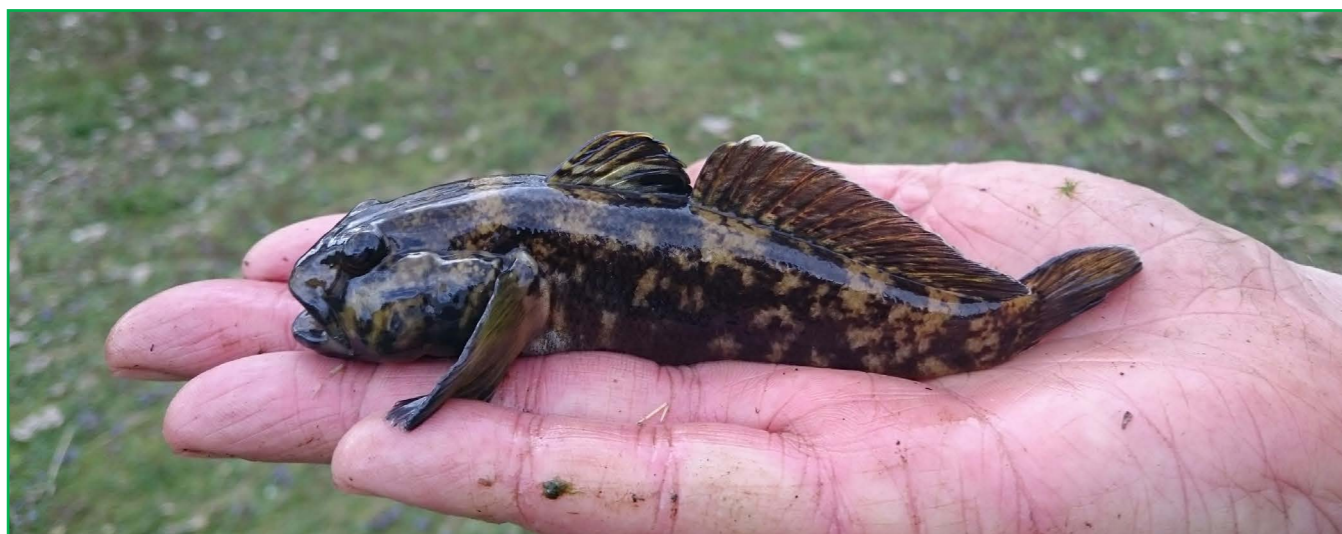
Le gobie à tache noire ( Neogobius melanostomus )

Sources : « les espèces invasives, le gobie à tache noire » Province de Liège, « Risk analysis of the round goby, Neogobius melanostomus , risk analysis report of non-native organisms in Belgium » Hugo Verreycken, Ecopedia, Esoxiste.com, Centre de ressources « espèces exotiques envahissantes ».