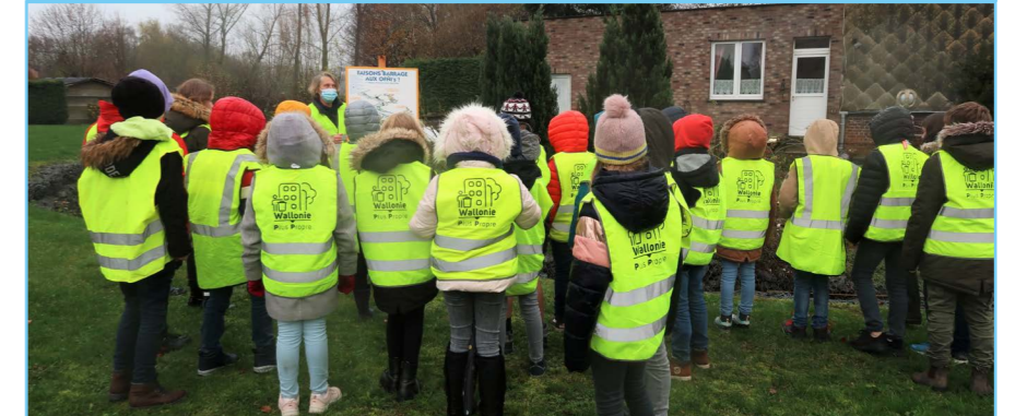
Le barrage flottant permet de récupérer les déchets dans la rivière et d'expliquer aux enfants les OFNIs (Objets Flottants Non identifiés)

même près de 130 enfants sensibilisés au cours de cette année scolaire.