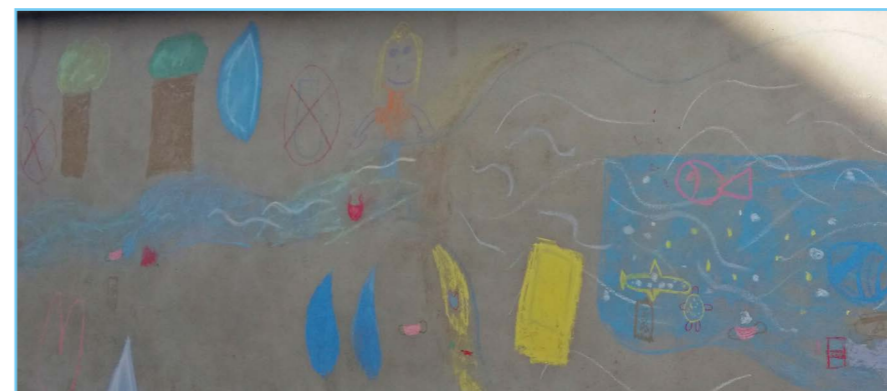
Fresque murale réalisée par les élèves de l'école communale de Naast (Soignies) dans le cadre de l'animation ©CRSenne

Pour aller plus loin, les différents Contrats de rivière de Wallonie ont décidé de créer un groupe de travail afin d'uniformiser l'animation sur tout le territoire. C'est ainsi que les animateurs des contrats de rivière ont échangé sur leur façon de faire, se sont enrichis les uns les autres et ont construit une trame commune comme base de l'animation. De la sorte, toutes les écoles de Wallonie auront les mêmes éléments en main, que l'animation dure 1h30 ou deux matinées, comme c'est le cas dans le bassin de la Senne.