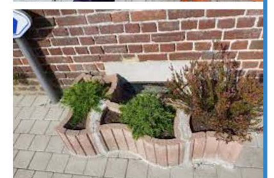
Quelques exemples de protections individuelles permettant de diminuer les impacts des inondations