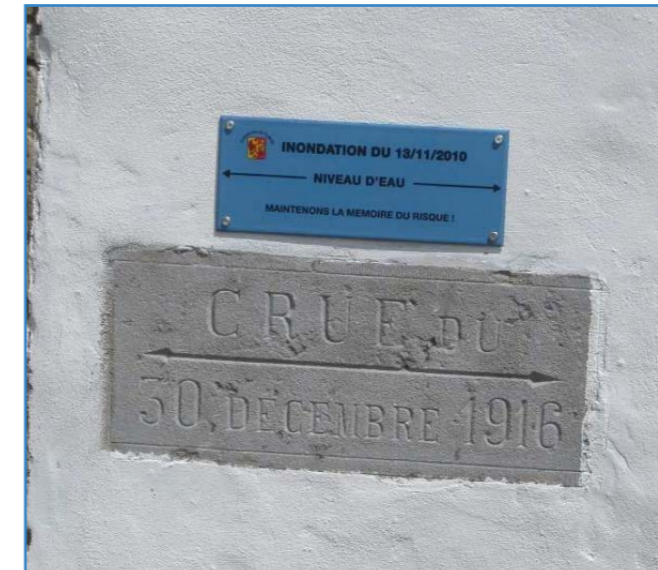
Repère de crue à Tubize, témoin indiquant le niveau maximal atteint lors d'inondations majeures